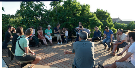
Apéro sociétaires (26)