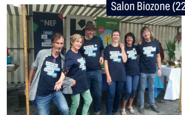
Salon Biozone (22)